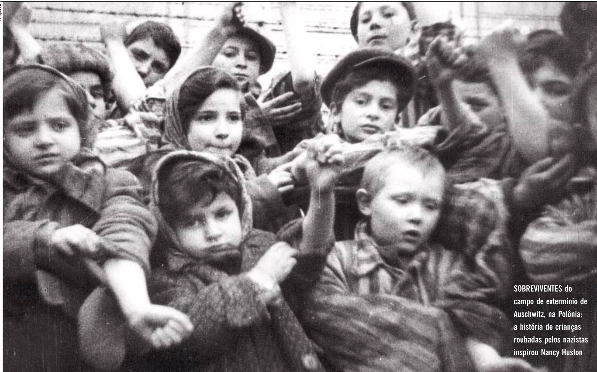
SOBREVIVENTES do campo de extermínio de Auschwitz, na Polônia: a história de crianças roubadas pelos nazistas inspirou Nancy Huston

A canadense Nancy Huston faz sucesso com romance sobre quatro gerações de uma família