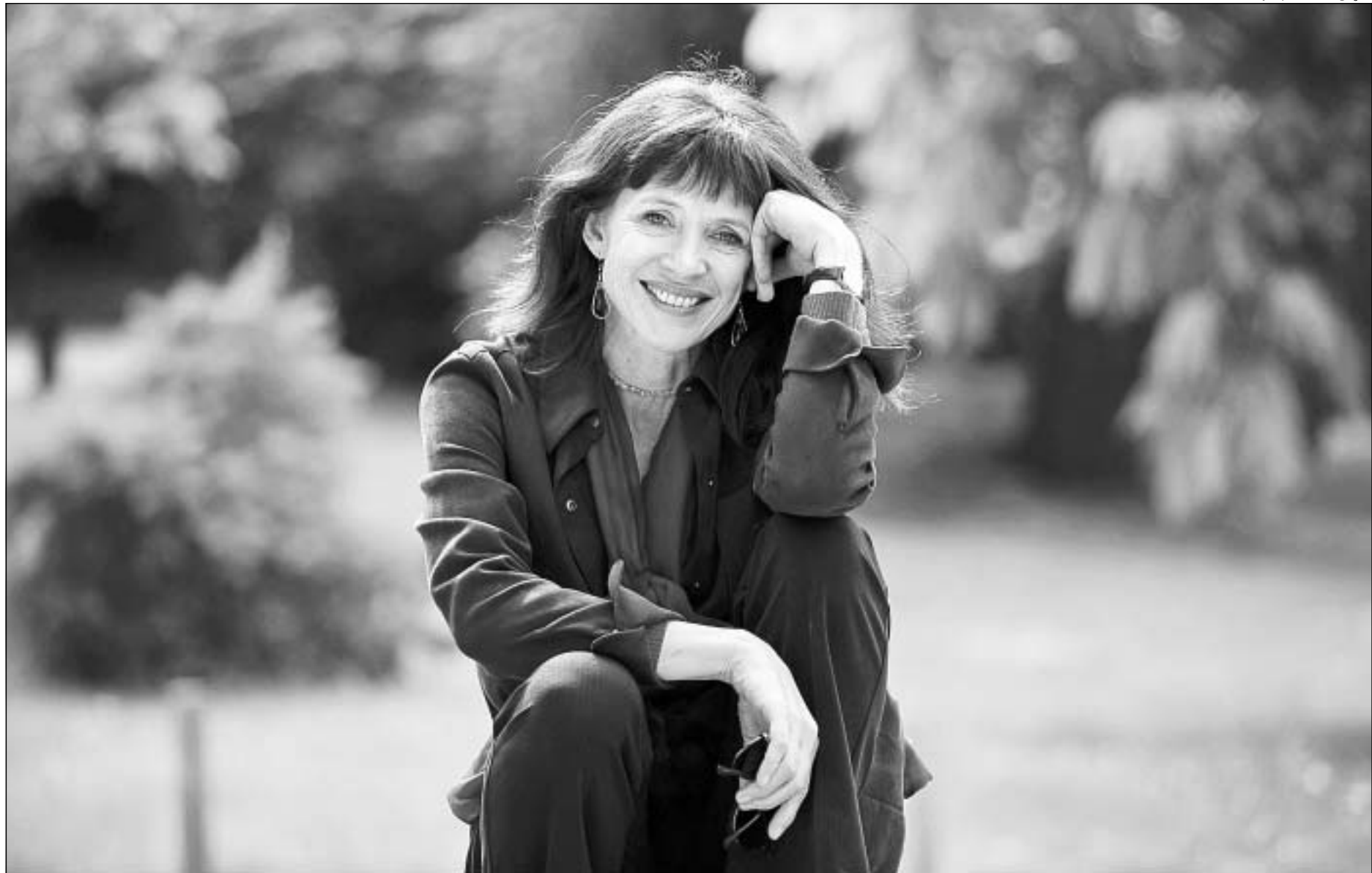
NANCY HUSTON, ex-militante feminista, desencantada com a esquerda hoje: "Chegando à idade adulta, cada geração está pronta a partir para a guerra para morrer ou matar por ideais"

NANCY: Escrevi um ensaio há mais de 20 anos sobre guerra e prostituição. Mas não tento denunciar violência nos meus romances. Um romance é feito para compreender. É claro que não gosto de guerra. Mas como ela existe, tento compreender como ela funciona, como pessoas começam a se odiar e como o ódio é implantado numa criança. São coisas que começam na infância. A criança recebe tudo através do corpo e das emoções, sobretudo, dos pais.